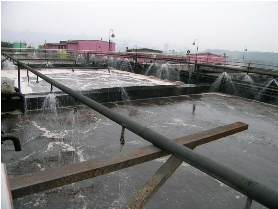
图3 预曝池纯氧曝气表面流态(左前为1#空气预曝池)

预曝池中安装一台GWQ-O2-1200扩散器。启动后即进行动力效率观察记录,当供氧量调整至50M 3 /h(71.5kg/h),溶解氧从低于0.2mg/l很快(5分钟)上升到9.3mg/l。因工艺只需2mg/l的溶解氧,故将供氧量下调到18~22M 3 /h范围内。该设备未经任何改进,正常运行至供氧试验结束,期间处理平均水量经历了50、60、90、130M 3 /h各个阶段,溶解氧始终可以维持在所需的2mg/l。同时,能提供很好的水力搅拌效果,整个水池泡沫较空气曝气池少。见图3。