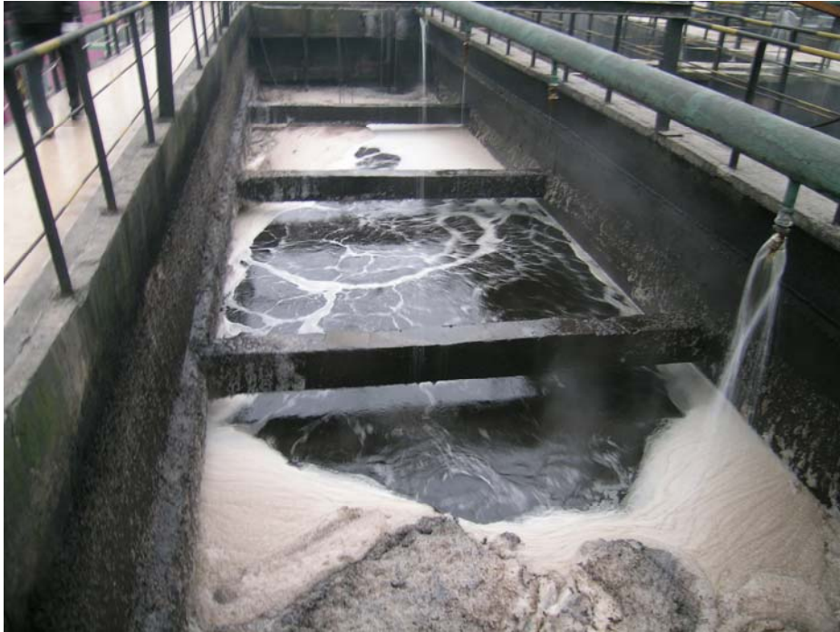
图 4 好氧池 1# 廊道纯氧曝气表面流态